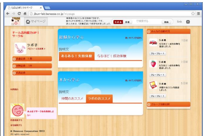
学び合い SLS (ソーシャルラーニングサービス) *グループ別に成功、失敗談や書籍情報を掲載